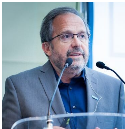
Javier Colás Valor en Salud Expresidente de Medtronic